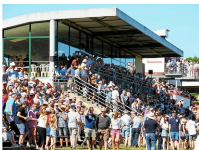
Plus de 2.000 personnes ont assisté aux courses.