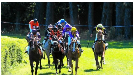
Entrée dans la dernière ligne droite: les efforts s'intensifient.

Fête des courses. Plus de 2000 spectateurs.