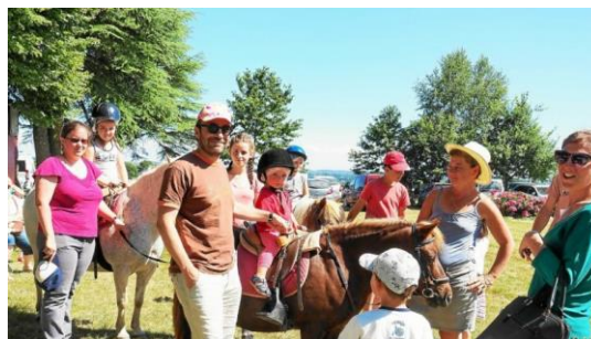
Petit tour d'hippodrome sur les poneys dociles du centre équestre du Boquého