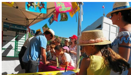
Le jeu du petit pronostiqueur pour les turfistes en herbe.

Samedi, plus de 2 000 spectateurs se sont rendus à l'hippodrome du Petit Paris, pour assister à la fête des courses. C'est sous un soleil éclatant qu'une soixantaine de chevaux a pris leur départ, ainsi qu'une poignée de poneys et leurs jeunes jockeys.